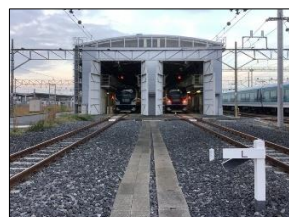
記念撮影エリア （東京方）