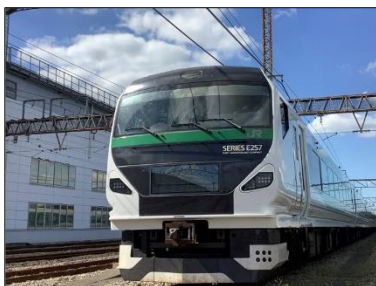
1~3号車(東京方)車両前面

(2) 記念撮影時の環境が異なるため、購入される座席(1~3号車の東京方と8~9号車の青森方)をお間違えないようご注意ください。号車や座席番号などは選択いただけませんのでご注意ください。イベント中、4・5号車を封鎖するため、東京方と青森方を行き来することは出来ません。記念撮影時も同様に、東京方と青森方を行き来することは出来かねます。