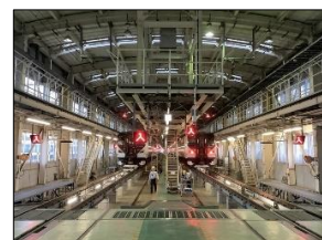
記念撮影エリア （青森方）