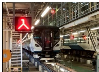
8~9号車(青森方)車両前面(貫通扉面)

(3) 車内販売はございません。配布するお弁当・飲料以外については各自でお持ち込みください。