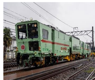
保守用車両撮影会