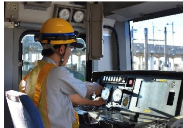
運転台機器操作体験