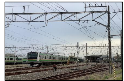
構内入換車両見学