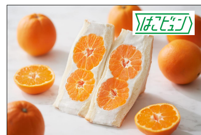
静岡県産みかんサンド (熱海フルーツキング)