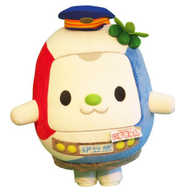
伊豆急公式キャラクター 「いずきゅん」