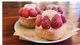
いちごシュークリーム