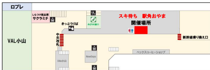
【小山駅構内 見取り図】

“学校帰りのスキマ時間を、スキな時間に”をコンセプトに、小山駅改札内の一角を無料でご利用いただける学生専用スペースとして期間限定オープンします。期間中、平日（月～金曜日）の夕方は駅を利用される学生の皆さまに電車やバスを待つ「スキマ時間」を有効に活用いただけるよう、“学生専用まちあい室”として開放します。また土曜日には多様な職種の講師を招き、学生限定の“体験型キャリアワークショップ”を無料で開催します。ワークショップでは実際に手を動かすワークの他、講師の方が今の職業に就いた理由などもお話いただけます。学生の皆さまにとって、ご自身のやりたいことを見つけたり、進路を考えたりするヒントになれば幸いです。