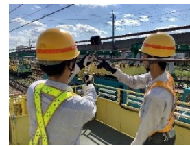
電力設備保守作業体験