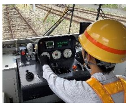
新幹線保守用車運転体験