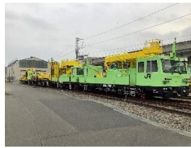
工事車両群撮影会