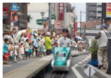
ミニ新幹線（E5系）乗車体験