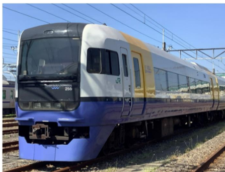
特急 255 系試乗会