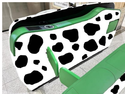
自動改札機ラッピングイメージ