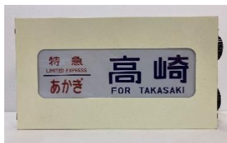
【185系ミニチュア方向幕】