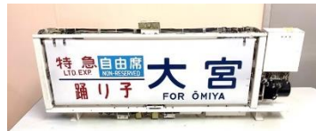
【側面行先表示器（185系）】