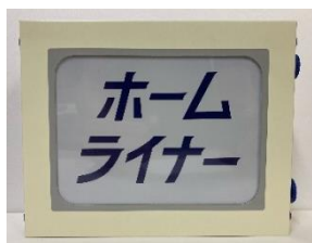
【185系ミニチュア正面幕】