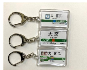
【駅名キーホルダー】