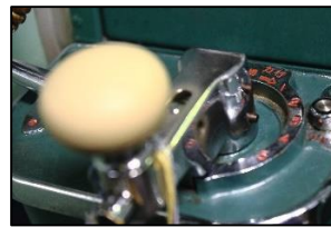
運転台写真撮影例