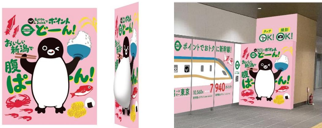
実際に触れて、撮影も楽しめる「太っ腹 Suica のペンギン」