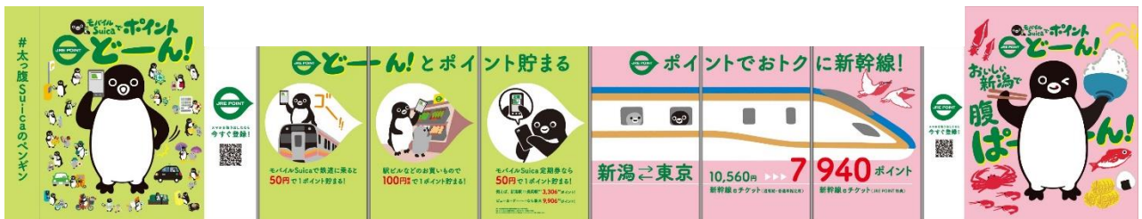
「太っ腹 Suica のペンギン」広告デザイン

場 所：新潟駅（万代広場側東西通路 CoCoLo 新潟 2F WEST SIDE 側コインロッカー付近） 期 間：2025年3月26日（水）～4月27日（日）