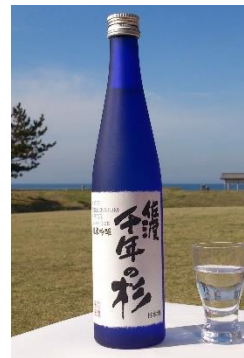
日本酒 佐渡千年の杉

魚沼産コシヒカリからつくった糰甘酒を濃縮してできた、発酵甘味料。原料は米と米糰のみのきれいな琥珀色をした「みつ」です。