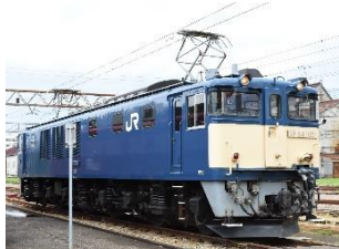
EF64形電気機関車 （自動連結器）