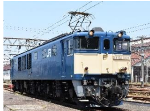
EF64形電気機関車 （双頭連結器）