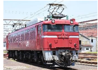
EF81形電気機関車 （双頭連結器）