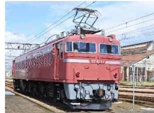
EF81形電気機関車 （自動連結器）