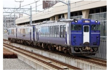
越乃 Shu*Kura 車両