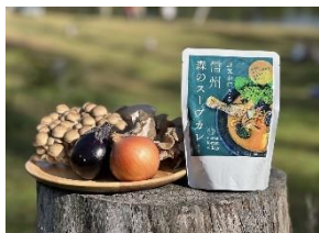
長野市・信州森のスープカレー

りんご（ふじ・シナゴールド等）、ぶどう（シャインマスカット・カガハ°-プル・クイーンルージュ）、きのこ、白菜、米、蕎麦、栗菓子、おやき等