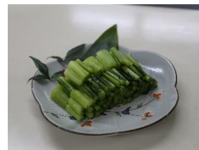
飯山市・野沢菜漬