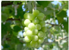
須坂市・シャインマスカット