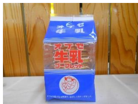
小布施町・オプセ牛乳