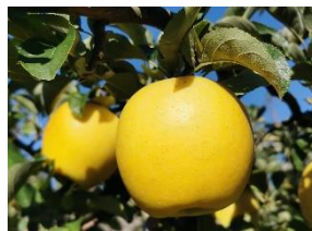
山ノ内町・シナゴールド