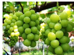
中野市・シャインマスカット