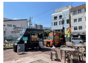
富士見駅前マルシェ