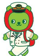
長野県PRキャラクター「アルクマ」 ©長野県アルクマ 14-0020