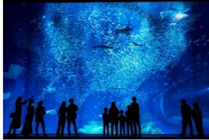
アクアワールド・大洗（イメージ）