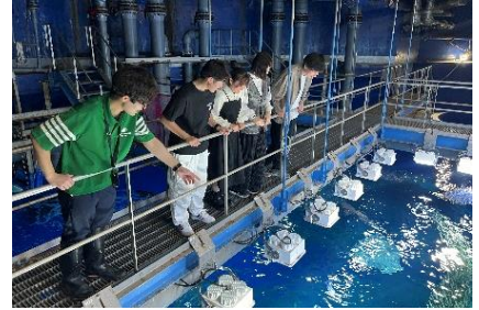
バックヤードツアー（イメージ）