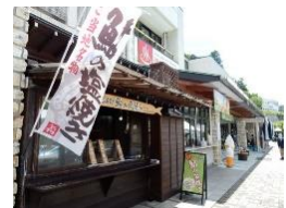
道の駅 奥久慈だいご