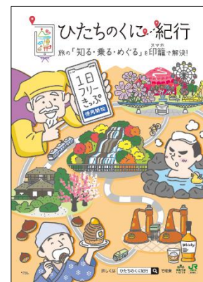
▲宣伝物 (ポスター・パンフレット)