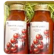
▲フルーツマトジュース