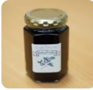
▲ブルーベリーコンフィチュール