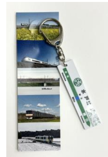
▲プレートキーホルダー 水戸駅 700円(税込) JR東日本商品化許諾済