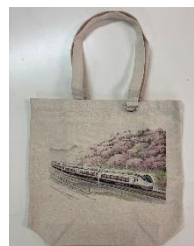
▲偕楽園の梅とE657系特急電車のトートバッグ 3,300円（税込）