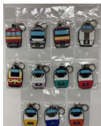
▲常磐線ラバーキーホルダー 各種770円（税込）