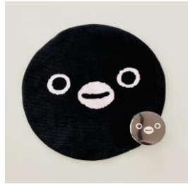
▲Suicaのペンギン圧縮タオルフェイス 660円(税込)