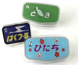
▲ヘッドマークアクリル 各種990円(税込)