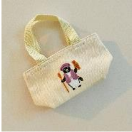
▲Suicaのペンギンマイクロミニトートバッグ 水戸黄門 550円(税込)

※お支払い方法は、現金のほか、Suicaなどの交通系電子マネー、クレジットカード(一括払いのみ)です。