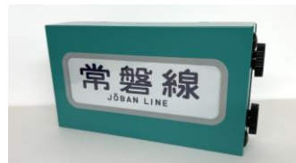
▲ミニチュア方向幕103系 常磐線 5,000円(税込)