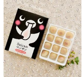
▲Suicaのペンギンいちごくりむ餅 648円(税込)