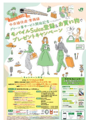
ポスターイメージ

(3) 対象店舗：アトレ吉祥寺、アトレヴィ三鷹、ルミネ立川、グランデュオ立川、エキュート立川、セレオ(国分寺・八王子・西八王子)