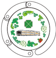
バッグハンガーイメージ