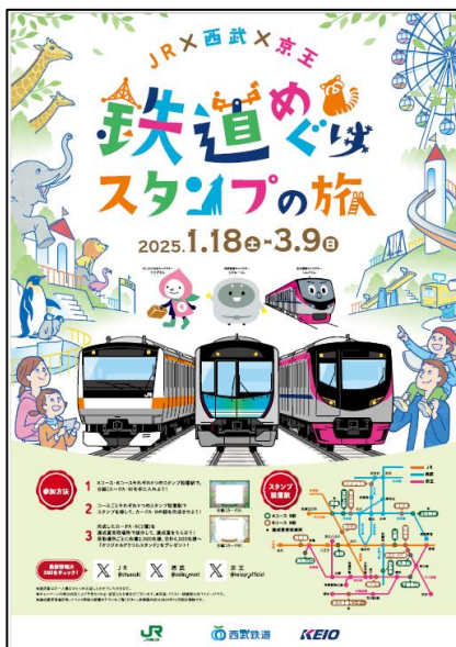
《ポスターイメージ》