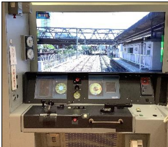
【ツーハンドルの運転台】

*車のアクセルに相当するマスコンとブレーキに相当するハンドルが分かれている運転装置。