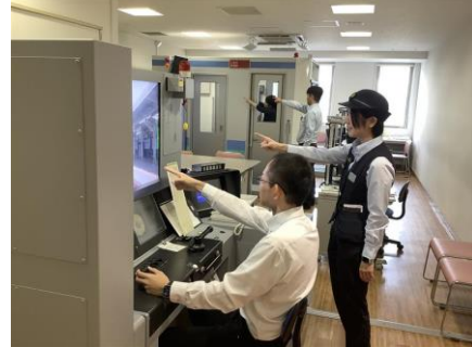
【運転士・車掌シミュレータ連動の様子】