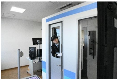
【ドア開閉操作体験】