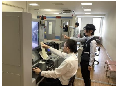
【現役乗務員が付き添いでレクチャー】