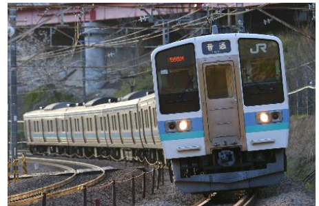
【中央本線を走行する211系】 211系のシミュレータで体験できます