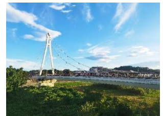
【ふれあい橋の風景】

★11月9、10日は、コース上の仲田の森蚕糸公園にて開催される「第58回日野市産業まつり」もお楽しみいただけます。