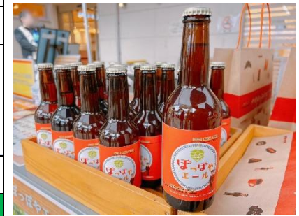
旅するスナックでご提供する 「ぽっぽやエール」