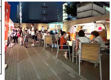
武蔵境会場のイメージ (過去の他イベント開催時より)