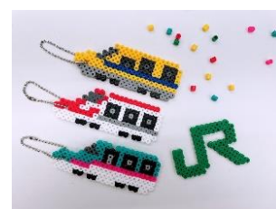
キーホルダーイメージ

ワークショップ (有料) (6F ROOFTOP TERRACE) アイロンビーズでオリジナルのキーホルダーを作ってみよう！ 料金：200円