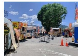
キッチンカー出店イメージ

Q-STAの駐車場スペースに気軽に食事を楽しんでいただけるキッチンカーを出店します。