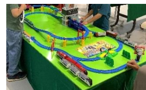
プラレール展示イメージ

JR 東日本、富士急行線で活躍する車両のプラレールを展示します。 お気に入りの車両を見つけよう！