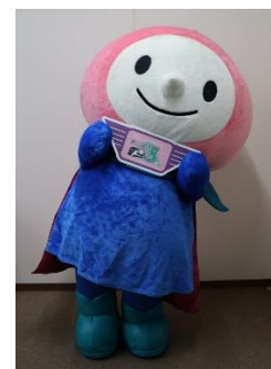
JRの山梨キャラクター モモずきん

JR 東日本と富士山麓電気鉄道のこども用の駅長制服をご用意しております。中央本線と富士急行線の直通90周年と富士回遊運行開始5周年を記念したロゴパネルやJRの山梨キャラクター「モモずきん」と一緒に写真撮影を楽しめます。