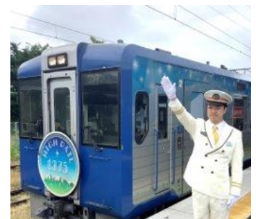
【HIGH RAIL1375 出発式体験】

※駅長制服は大人用もしくは子ども用（子ども用は帽子と上着のみ） 1名さま分のご用意となります。