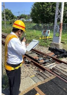
【ポイント転換体験】