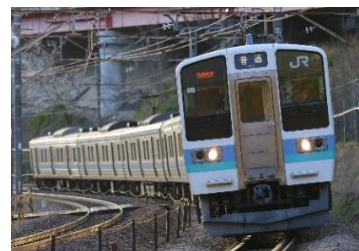
【中央本線を走行する 211 系】

※「入換車両」…留置線に入る電車、出てくる電車を入換車両という。 ※「非常ドアコック」…異常時に手でドアを開ける装置。 ※「コンプレッサー」…扉の開閉などに使用する空気をつくる機械。 ※「ポイント転換」…電車の進入方向を決める。 ※「継電連動装置」…スイッチやボタンを用いて信号やポイント进行操作し電車の進入方向を決める装置。