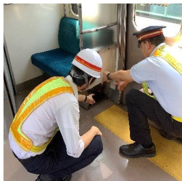
【非常ドアコック扱い体験】