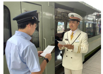
【運転通告券交付体験】

「運転通告券」とは…駅社員から直接乗務員に対して、運転方法等を通告 するために用いられます。一例として、列車の運転時刻の変更、雨や風など による速度規制、信号機が故障した際の運転方法などの通告があります。