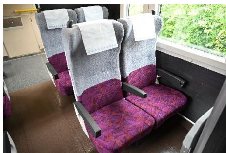
グリーン車（車端席）