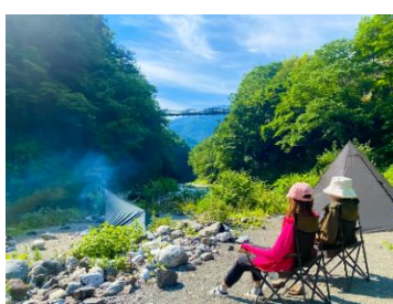
#鉄キャン（イメージ）