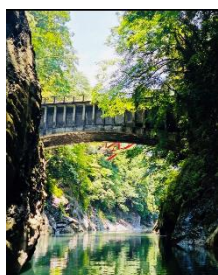
甲斐の猿橋（イメージ）

グリーン車に乗っておでかけできる沿線の観光情報の他、五日市線や東京アドベンチャーラインといったエリアに電車に乗っていくキャンプ「#鉄キャン」をはじめ、様々なアクティビティの情報発信をします。