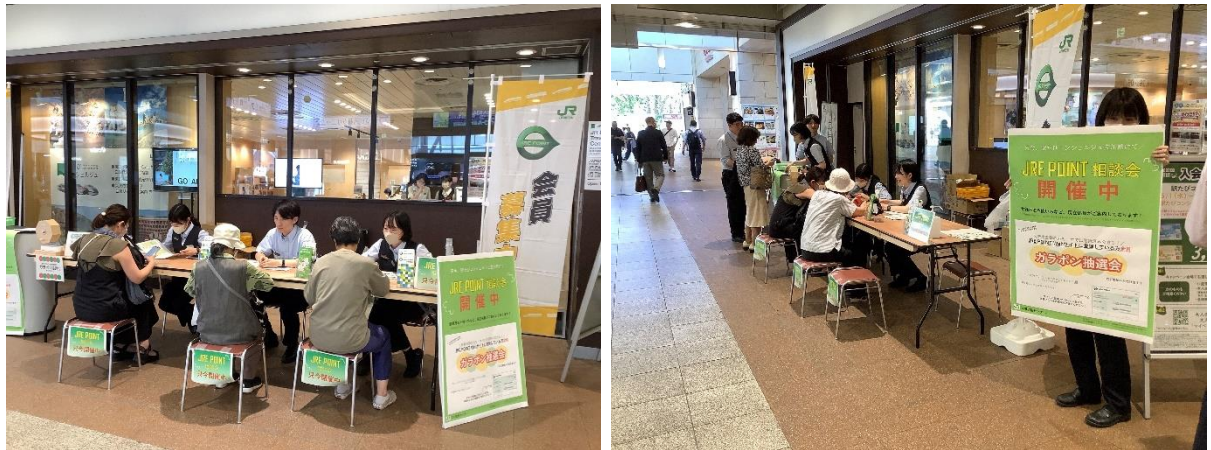
※過去に開催した相談会のイメージです