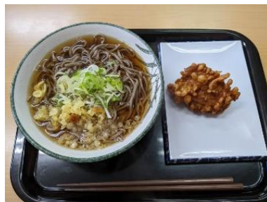
甲府市特典（山賊揚げハーフ）