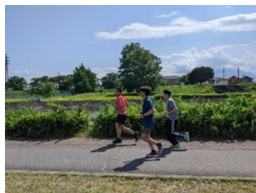
甲府市 荒川河川敷