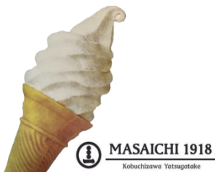
北杜市特典（ソフトクリーム）

受付場所 石和温泉駅観光案内所（中央本線 石和温泉駅南口） 受付時間 9:30～15:00 入浴施設 ホテル花いさわ（南口徒歩約5分）、石和びゅーほてる（南口徒歩約25分）、春日居びゅーほてる（南口徒歩約20分） 特典 【入浴料：通常大人1,650円のところ、1,100円に割引】 ・かすてら 榎や 200円以上お買い上げで「カステラのラスク」をプレゼント ・石和温泉駅観光案内所で受付時に「入浴剤」をプレゼント ※無くなり次第終了です ・石和温泉駅観光案内所で「ワインの試飲」ができます