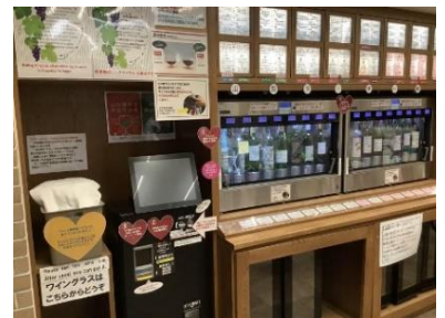
笛吹市特典（ワインの試飲）

※ランニング中のケガ・事故等には十分お気をつけください。参加時におけるケガ・事故等の責任は負いかねます。