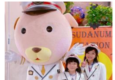
③「駅長犬」グリーティング