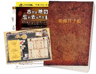
謎解きキット（イメージ）