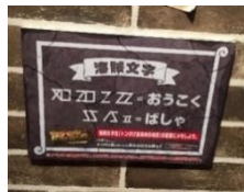
手がかり（イメージ）