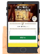
解答報告（イメージ）