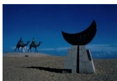
【月の沙漠記念公園】