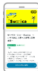
【iSumica スマートフォン等のチケット購入画面】