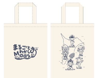
【オリジナルトートバッグ イメージ】