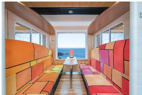
リゾートしらかみ「樺」 2号車 ボックス席

リゾートしらかみ2号車ボックス席はすべて海側に配置されており、日本海の美しい景色を楽しむことができます。テーブル付きで向かいあって座ることができるため、ご家族や友人と一緒に食事や会話を楽しみながらの列車旅に最適です。