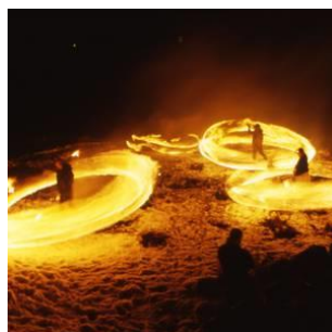
角館の火振りかまくら