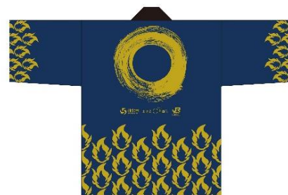
特別体験専用の法被