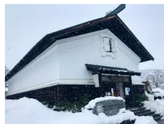
仙北市観光情報センター「角館駅前蔵」