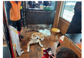
第1弾の車内の様子