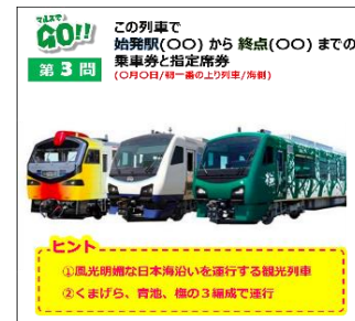
【マルスで GO ! 問題(イメージ)】