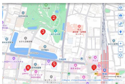
Z17LE 第1041号 【ランタンウォークスタンプ設置場所】