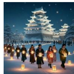
【ランタンウォークイメージ画像】 ※生成 AI 作成