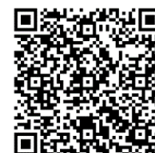
【事前申込用 二次元コード】