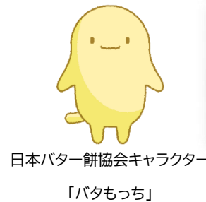
日本バター餅協会キャラクター 「バタもっち」