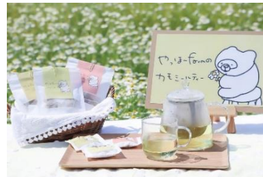
やつほ～farm のカモミールティー