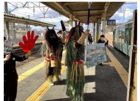
お出迎えとお見送り