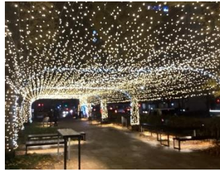
【光のトンネル（2023年度）】