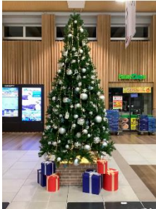
【クリスマスツリー（2023年度）】