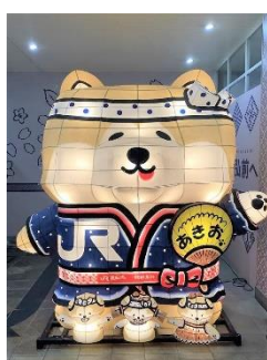
「あきおねぶた」（イメージ）