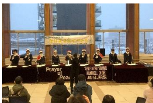
【聖霊学園高等学校によるハンドベル演奏（2023年度）】