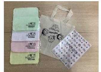
【おらわんノベルティ イメージ】

※おらわんとは、秋田犬をモチーフにした JR 秋田支社公式 X「アキツガ info!」のキャラクターです。