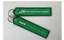
鉄道のまち大宮オリジナルトレインタグ (表・裏イメージ)

引換条件: チラシを一人で複数枚お持ち込みされても、一人につき一つのお渡しとなります。