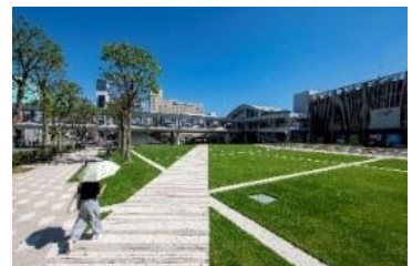
秋田駅西口駅前広場(芝生広場)

※詳しくは、JR 秋田支社公式 X のアキツガ info! 等でお知らせします。