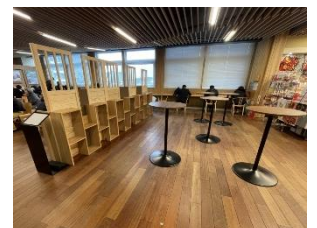
特設コーナーイメージ