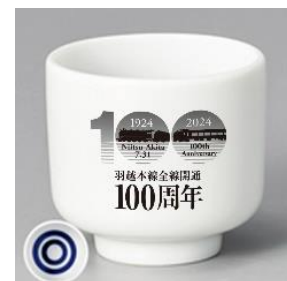
オリジナルおちょこ(イメージ)