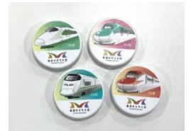
オリジナル新幹線マグネット(イメージ)