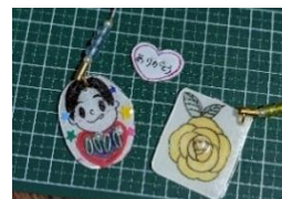
プラ板キーホルダー（イメージ）