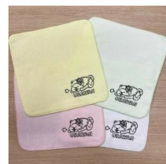
おらわんミニタオル

※おらわんとは…JR 秋田支社公式 X の「アキツガ info!」のキャラクターです。