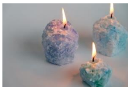
キャンドル完成（イメージ）