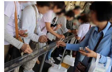
【流しじゅんさいイメージ】