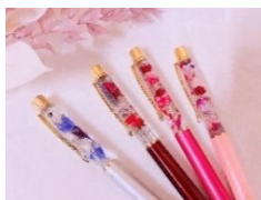
ハーバリウム完成（イメージ）