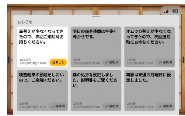
「施設スタッフからメッセージ通知」