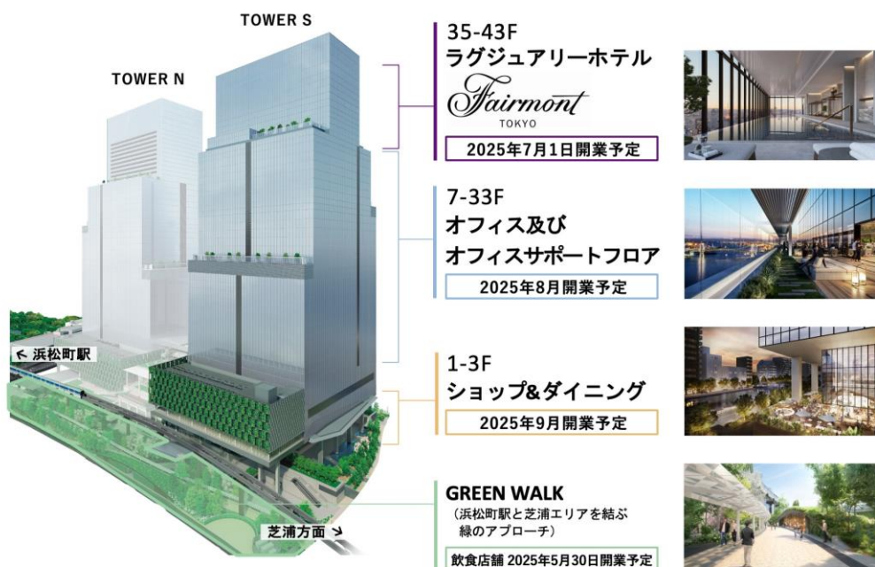
【図1】各施設の開業スケジュール

各施設の情報は下記、WEB サイトと SNS をご確認ください。今後、詳細な開業日や営業内容が確定次第、ニュースリリースや下記 WEB サイト等にて情報発信をまいります。