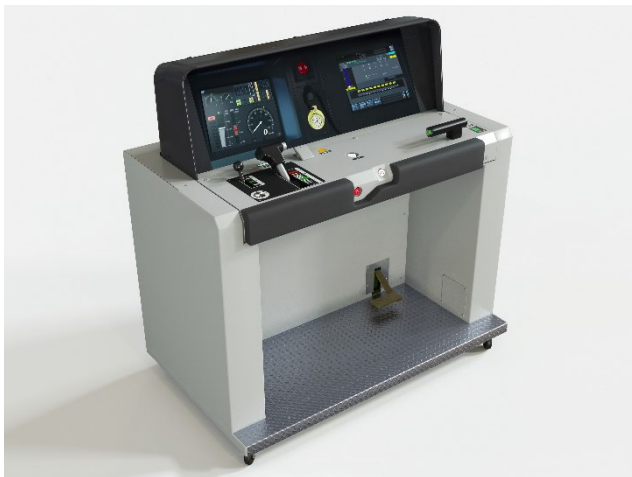
マスコンユニット+計器盤モニター+運転台