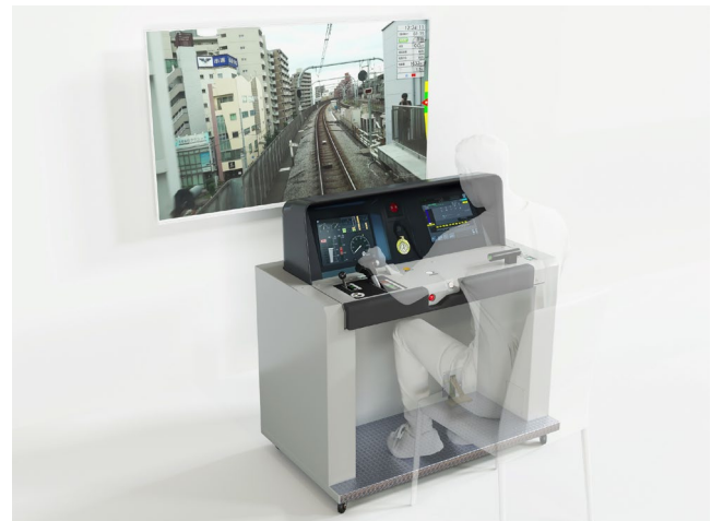
マスコンユニット使用によるシミュレータ運転イメージ

※画像はイメージであり、実際に販売するものと一部異なる場合があります。 ※右図の風景映像を映しているモニターは商品に含まれません。