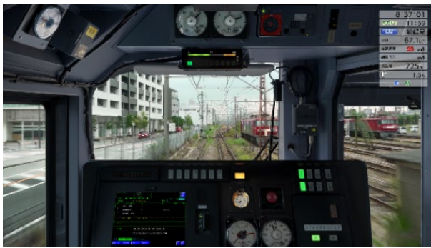
東海道貨物線 DLC プレイ画面

https://store.steampowered.com/app/2111630/JR_EAST_Train_Simulator/?l=japanese