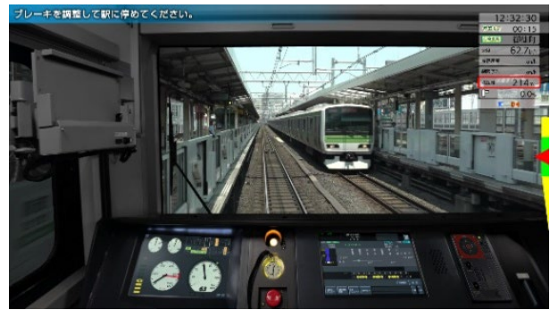
山手線 DLC プレイ画面