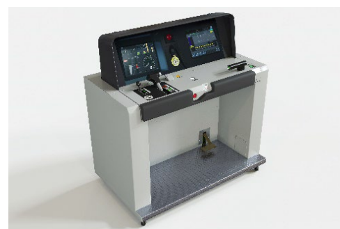
マスコンユニット+計器盤モニター+運転台（イメージ）

※マスコンユニット及び計器盤モニターは、NVIDIA が提供するクラウドゲームサービス「GeForce NOW」には対応していません。