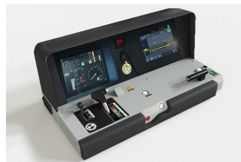
マスコンユニット+計器盤モニター（イメージ）