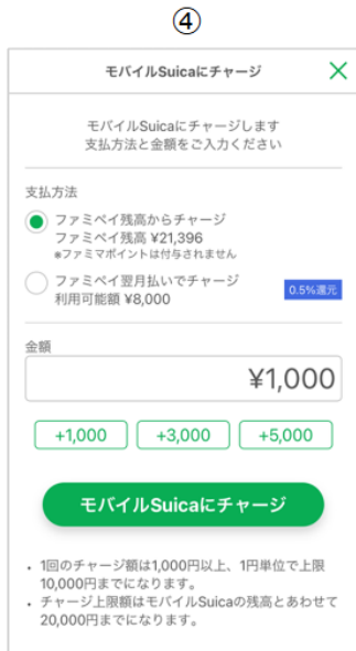
支払方法・金額の設定