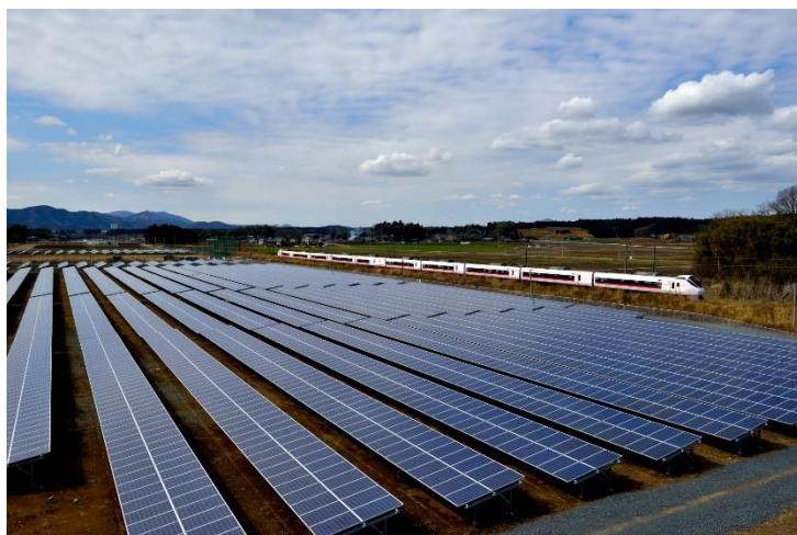
JR 東日本グループの再生可能エネルギー導入事例 (常磐線友部・内原間 太陽光発電所)

(※2) PPA (Power Purchase Agreement) は、発電事業者や小売電気事業者と需要家 (電力の使用者) との間で行われる、再生可能エネルギーの発電・電力売買するための電力契約のこと。